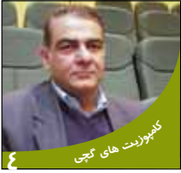
کنفرانس های نجف