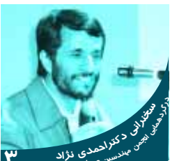
مختصراتی دکتر احمدی نژاد دانشجویی - تحصیلی