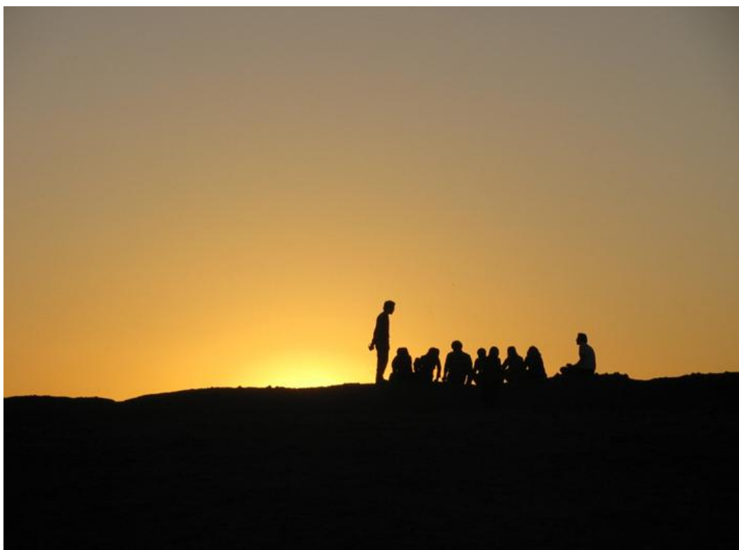
روستای کوره‌گز - پنج‌شنبه ۵ بعد از ظهر