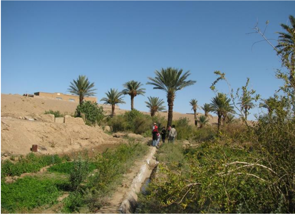
روستای عروسان- پنج‌شنبه ۱۱ صبح

آب روستای عروسان با توجه به اقلیم خشک و بیابانی منطقه، کاملاً شیرین است (البته نوشیدن آن به افرادی که به آب چاه عادت ندارند توصیه نمی‌شود). خانه‌های روستا اغلب مخروطی هستند. چند رأس درخت نخل و انار، و سبزیجاتی همچون گوجه فرنگی، کدو، بادمجان و تره در آن کاشت می‌شود. جالب آن‌که روستای عروسان تنها یک نفر سکنه دارد که از طریق دامداری (گوسفند، شتر، بز) و کشت سبزی و میوه، حیات خود و روستا را تأمین می‌کند.