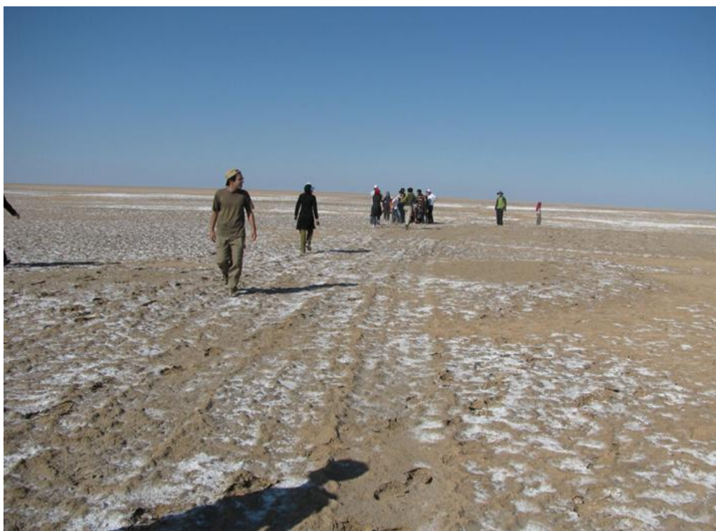
دریاچه نمک- پنجشنبه ۲ بعدازظهر

ساعت نزدیک ۳ با ماشین به سمت رمل‌ها حرکت کردیم. متأسفانه پس از نیم ساعت متوجه شدیم که مسیر را اشتباه آمده‌ایم. با توجه به اینکه هوا تا ساعت ۵:۳۰ تاریک می‌شد، و از آنجا که نمی‌خواستیم بازدید از تپه‌ماهورها را از دست بدهیم، سریعاً به کوره‌گز بازگشتیم و پس از جمع کردن وسایل، به سمت تپه‌های نزدیک عروسان به راه افتادیم.