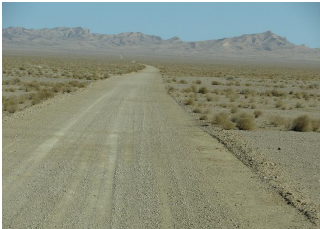
جاده خور به عروسان- پنجشنبه ۱۰:۱۵ صبح

«عروسان» روستایی کوچک در ۴۰ کیلومتری شمال شهر خور است. جاده‌ای که از خور به عروسان می‌رود، ناقصی از مسیر آسفالته است و پس از دوراهی جاده خاکی شروع می‌شود، که در ابتدا حالت شوسه دارد و هرچه پیش می‌رویم کیفیت آن بدتر می‌شود.