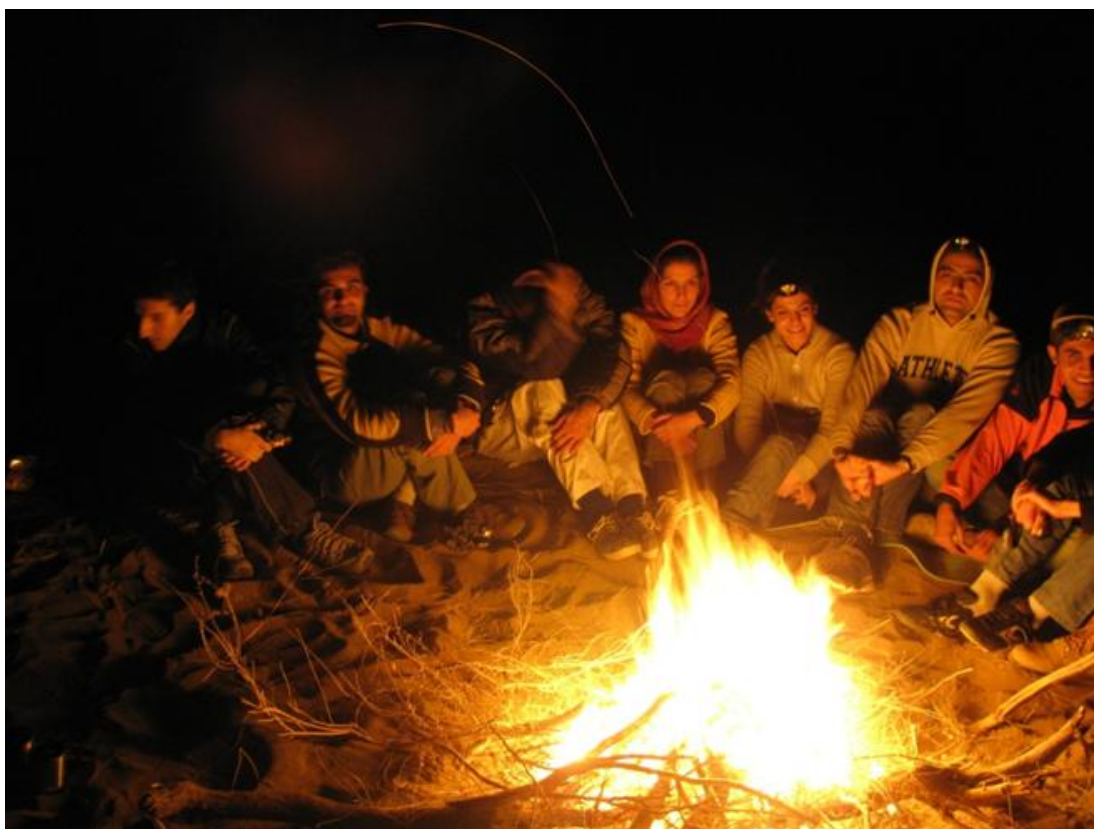
شب‌مانی در تپه‌ماهورهای نزدیک عروسان- پنج‌شنبه

صبح جمعه ۸ صبح از خواب برخواستیم. پس از جمع کردن چادرها و وسایل، بعضی از اعضا به پیاده روی بر روی رمل‌ها پرداختند. ساعت ۹:۳۰ با مینی‌بوس به سمت خور حرکت کردیم. در بین راه یک بار در روستای عباس آباد (۱۰ کیلومتری شمال خور) و یک بار در وسط جاده برای