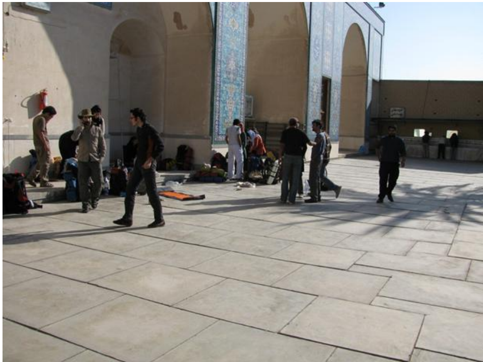
شبیستان مسجد نبی خور- پنجشنبه ۹ صبح

صرف صبحانه، تهیه مواد غذایی و کوله‌چینی اعضا کمی بیش از حد طول کشید. در نهایت ساعت ۹:۴۵ با مینی‌بوس به سمت روستای عروسان به راه افتادیم.