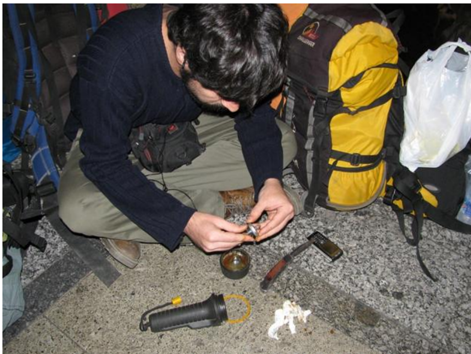
استفاده بهینه از وقت اضافی در ترمینال - چهارشنبه ۷:۳۰ عصر

قرار حرکت ساعت ۷ بعد از ظهر روز چهارشنبه در سالن ایستگاه مترو ترمینال جنوب بود. تا ساعت ۷:۴۵ همه‌ی اعضا به جز ۵ نفر به قرار رسیده بودند و اتوبوس آماده حرکت بود. به محض رسیدن این دوستان در ساعت ۹ شب به سمت مقصد به راه افتادیم.