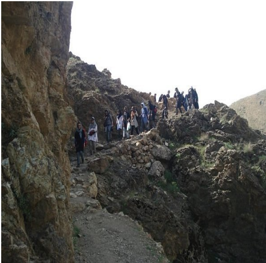
ورود به جنگل کارا

اتفاق جالب خواهش یک زوج جوان برای همراهی با تیم دانشگاه بود که سرپرست نیز مانع نشدند و ایشان نیز به سمت کارا آمدند.